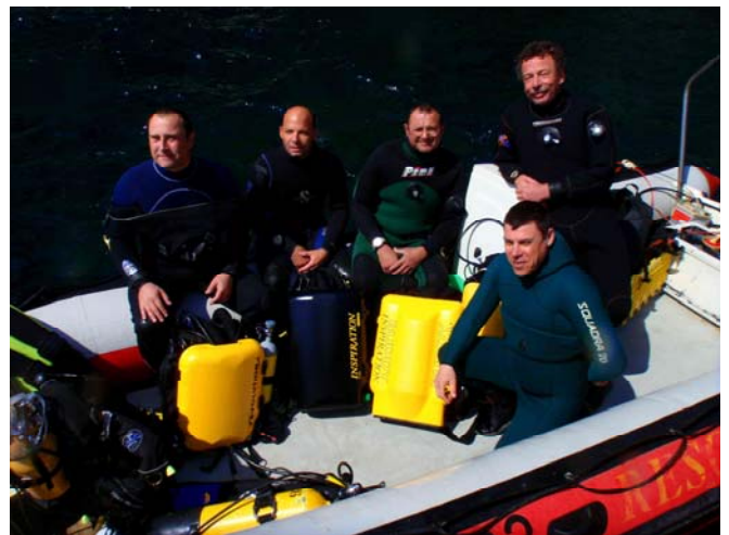
stage Giens trimix Avril 2009