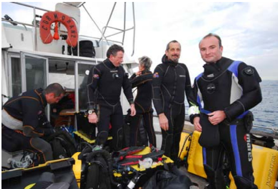
Stage trimix en decembre 09 avec l'Aide du Vieux Plongeur

Pour un comité comme le nôtre, c'est aussi permettre la « formation continue des enseignants » par une application effective de tous les domaines d'apprentissage liés à la théorie de la plongée. C'est aussi pour les moniteurs, la possibilité de redevenir un « apprenant » avec tous les avantages de transversalité que cela sous entend.