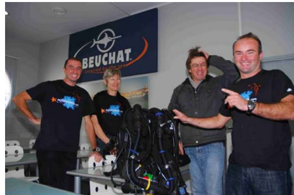
Théorie avec le Redacteur en Chef de SUBAQUA