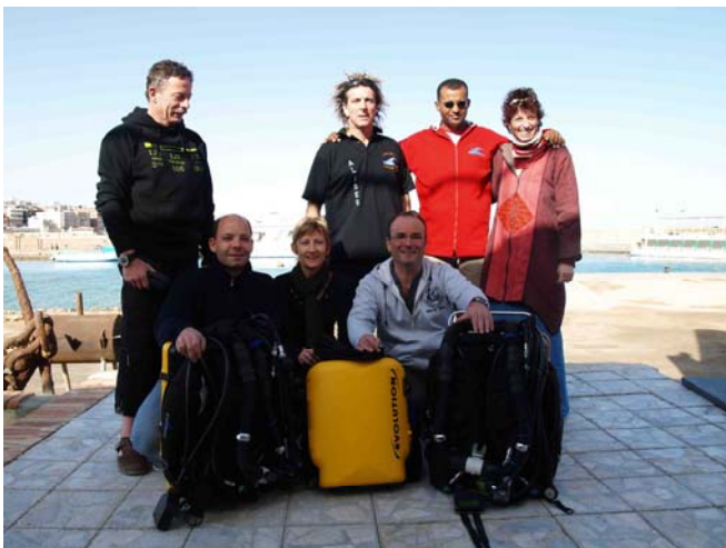
Stage mer rouge formation air fev 2009

Ces petites actions de « confirmation » ont pour but , particulièrement en plongée profonde (zone des 100 Mètres), de donner de l'expérience aux plongeurs récemment qualifiés.