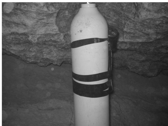
Oui ce bloc est bien déposé dans l'eau.