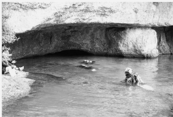
On y va ?

Dix stagiaires présents à ce stage, un record. Sept stagiaires en découverte (le baptême de plongée souterraine) ; trois dans la phase suivante, acquisition des techniques de base. Le stage s'est déroulé par un temps splendide. La qualité des stagiaires et la préparation préalable de leur matériel ont permis que tout se passe avec fluidité.