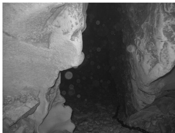
Oserez-vous entrer ?