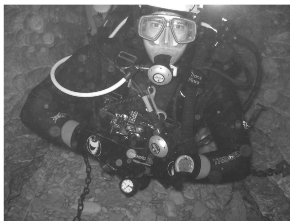
Que c'est chouette !